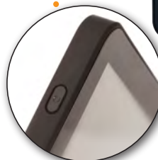
Formschönes und schlankes Design